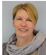
Katja Kaluza Umzüge

Telefon: 02302 28246-21 E-Mail: erikpohlmann@quabed.de